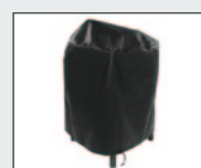
Copertura - Cod. 718.130139