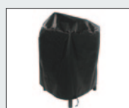
Copertura - Cod. 718.130139